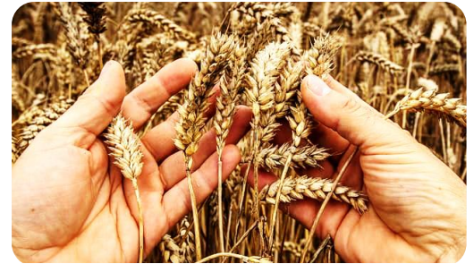
En Ukraine le blé attend d'être moissonné

Les médias rapportent que la Russie et l'Ukraine pèsent plus de 30 % des exportations mondiales de blé, bloqué actuellement en Mer Noire, d'où la crainte pour certains pays de voir exploser le cours du blé et s'installer la pénurie, rendant encore plus fragiles les pays pauvres les plus dépendants. C'est le cas en Afrique, de la Guinée.