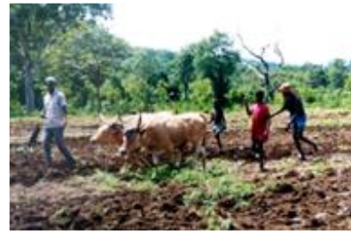
Aux bœufs de labour, il nous faut ajouter charrue, herse, joug

En 2021 votre Générosité n'a pas faibli. 2022 dépend de vous !