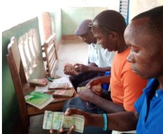
La jeune équipe vérifie les dons retirés

Au nom de mes collègues de travail en Guinée, je dois informer le président et les autres membres du bureau de l'Association Anjou-France que, grâce aux virements du 4 février et du 10 Mars 2022, l'association locale va pouvoir acheter trois décortiqueuses pour les trois villages de FEMBEDOU, KOFFODOU et WOLDOU , comme initialement prévus dans le plan triennal (2022-2024), précisément pour l'année 2022.