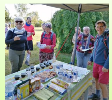
Un moment de convivialité

Dès réception de ce bulletin et pour gérer l'intendance, vous pouvez déjà vous inscrire au plus tard pour le mercredi 24 août , auprès de Pierre Pageot : Tél. 02 41 32 03 05 ou de Maurice Vigneron : Tél. 02 41 32 02 55.