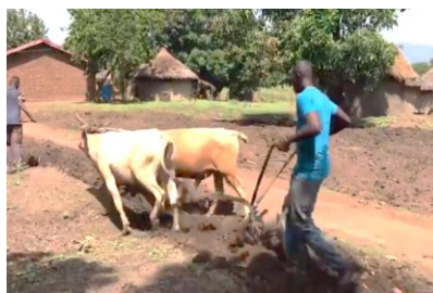
Un moyen de labour écologique